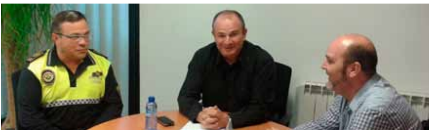
Entrevista con los responsables de tráfico

Des del mes maig del 2012 que estem intentant entrevistar-nos amb el Sr. Alcalde, primer, en dos ocasions, a través de la web de l'ajuntament en l'apartat "PARTICIPA, L'Alcalde a un clic" amb respostes evasives, i finalment, per sol·licitud via registre d'entrada a principis d'agost del 2012 i seguim a l'espera. Sense contestació.